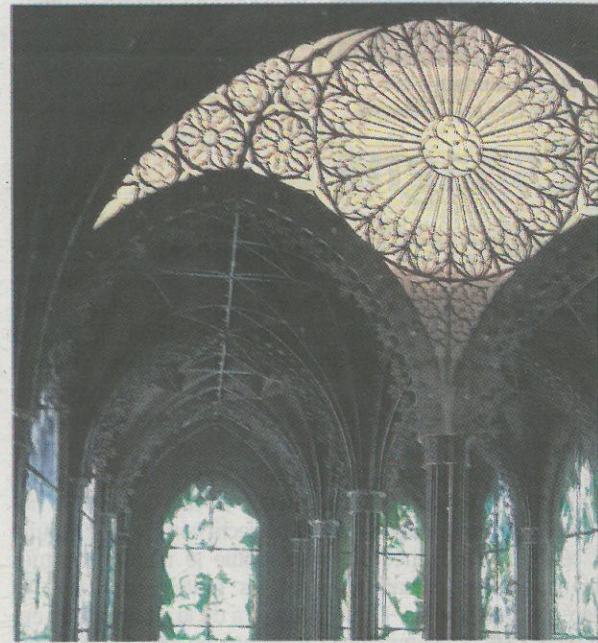
Les vitraux païens de «La Chapelle» seront bientôt démontés

Exposée en continu depuis 2006, «La Chapelle» laissera la place à un espace consacré à des activités pédagogiques dans le cadre de son programme éducatif. EMILIE ÉTIENNE