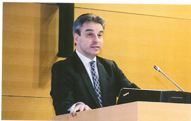
Claude Meisch, ministre de l'Education nationale, de l'Enfance et de la Jeunesse