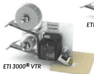
ETI 3000® VTR