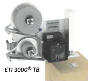
ETI 3000® TB